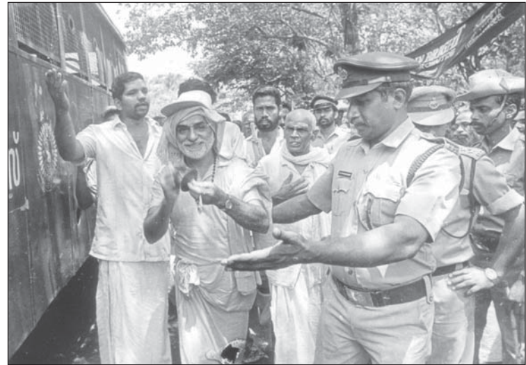
പുജ്യസ്വാമിജിയും അനുയായികളും സംരക്ഷണ കുറ്റുവീതിൽ