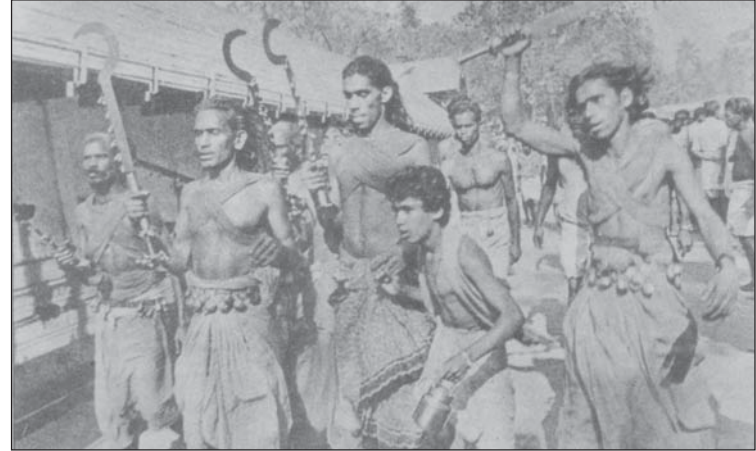
ക്ഷേത്രത്തിനു ചുറ്റും ഓടുന്ന വെറിപിടിച്ച ഭക്തന്മാർ

കൊടുങ്ങല്ലൂർ ഭഗവതീക്ഷേത്രത്തിലെ പരമ്പരാഗത ചടങ്ങുകളിൽ മാറ്റം വരുത്തുന്നത് എതിർക്കുമെന്നും, പുജ്യസ്വാമിജിയും അനുയായികളും ഇടപെട്ടാൽ ചോരപ്പുഴ ഒഴുക്കുമെന്നും ദേവീഭക്തന്മാർ പ്രതിജ്ഞചെയ്തു.