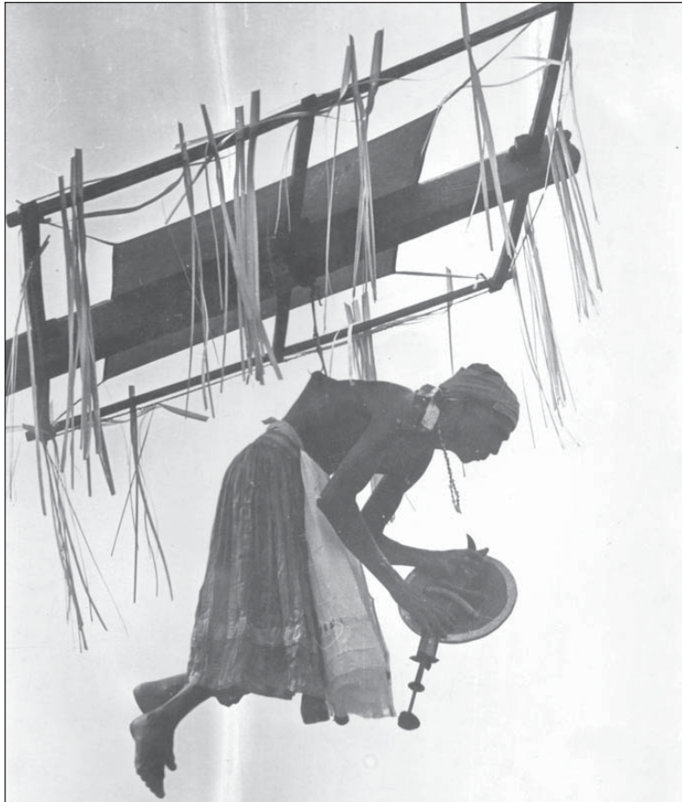
32 അടി ഉയരമുള്ള തൂക്കുമരത്തിൽ തൂങ്ങുന്ന 'പകരക്കാരൻ'.