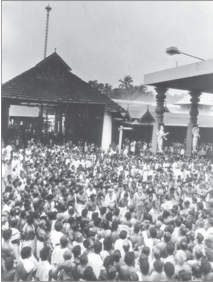
പഞ്ചവാദ്യക്കാരെ പ്രോത്സാഹിപ്പിച്ചുകൊണ്ട് പുജ്യസ്വാമിജി ജനമധ്യത്തിൽ.

ക്ഷേത്രങ്ങളിൽനിന്നും മതവിവേചനം നീക്കംചെയ്തൽ പ്രസിദ്ധമായ ഗുരുവായൂർ ക്ഷേത്രാങ്കണത്തിലെ പ്രഥമഹരി ജനപഞ്ചവാദ്യസേവയ്ക്കു സാക്ഷ്യം വഹിയ്ക്കാനായി കേരളത്തിന്റെ വിവിധഭാഗങ്ങളിൽനിന്നെത്തിയ ആയിരത്തിലേറെ ഭക്തജനങ്ങൾ (23.7.88).