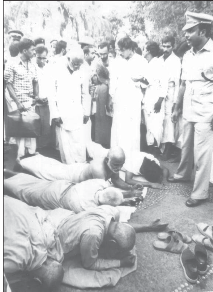
ഭഗവതിയ്ക്കായുള്ള പ്രാകൃതവഴിപാടുതടയൽനീക്കത്തിൽ, പോലീസ് പ്രതിബന്ധത്തിനും സംരക്ഷണ അറസ്റ്റിനുമെതിരെ എളവൂർ പുത്തൻകാവ് ക്ഷേത്രത്തിനടിമുഖമായി പുഷ്പസാമിജിയും മറ്റു സംസ്യാസിമാരും നമസ്കരിയ്ക്കുന്നു.